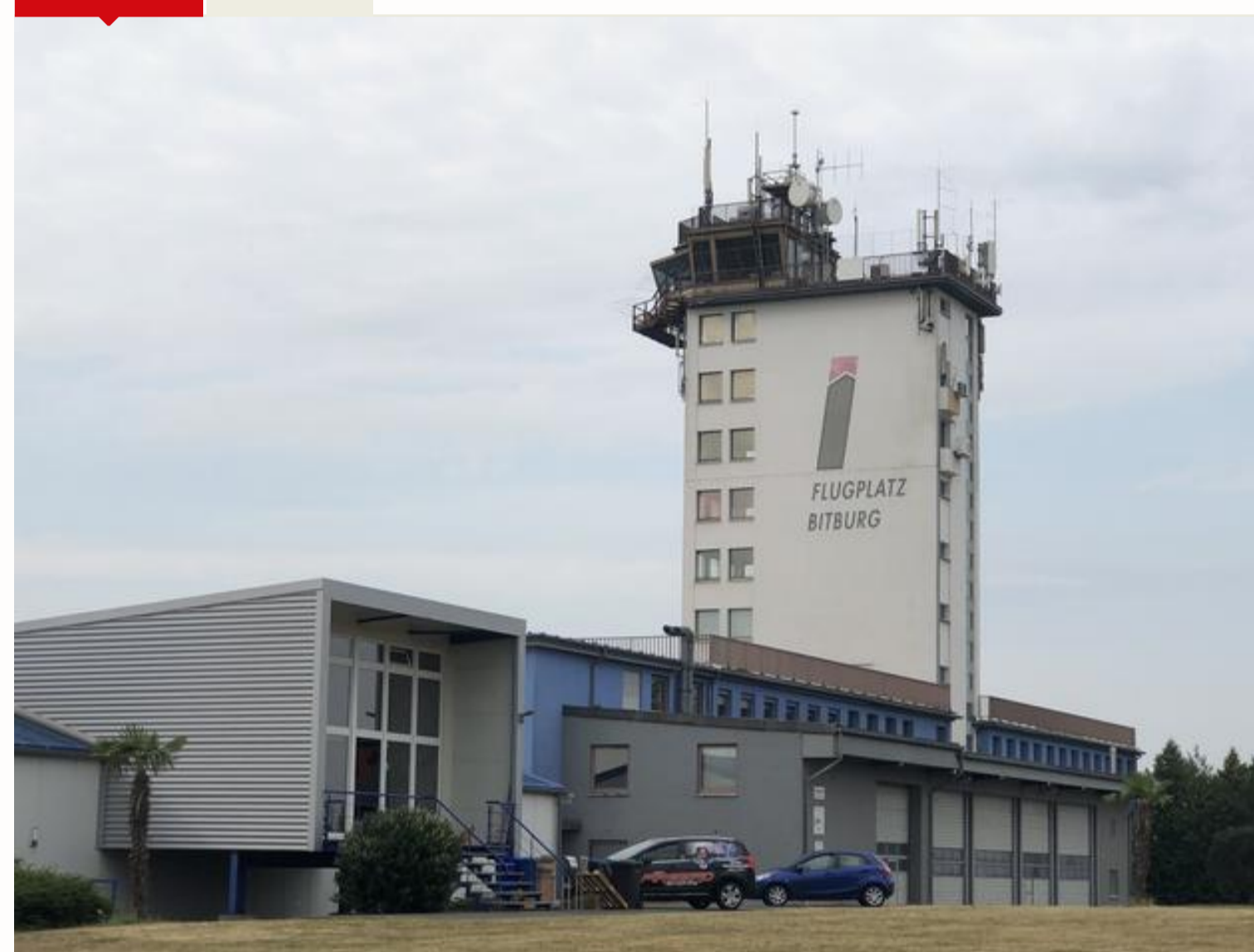
Der Bund hat den Auftrag zur Planung der Sanierung PFC-belasteten Erdreichs im Gewerbegebiet Flugplatz Bitburg vergeben.

Wie die Bundesanstalt für Immobilienaufgaben mitteilt, hat die Darmstädter Firma Arcadis den Auftrag für die Planung der Sanierung PFC-belasteter Böden auf dem Flugplatzgelände in Bitburg erhalten.